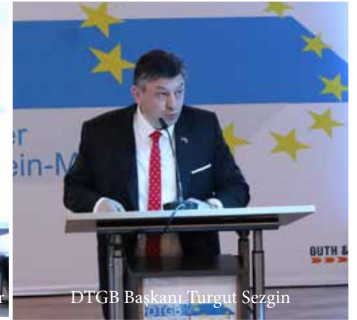
DTGB Başkanı Turgut Sezgin